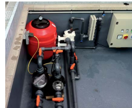
Die Aqua Diamante Zelle in der Mitte zwischen Sandfilter und Schaltschrank

Dazu kommt eine Reihe positiver Nebeneffekte: